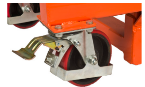
Lenkräder mit Bremsfunktion